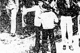
Група људи, вероватно политички радници.

«... Хоџа је био један од најбољих политичких радника у Југославији. Он је био један од најбољих политичких радника у Југославији.»