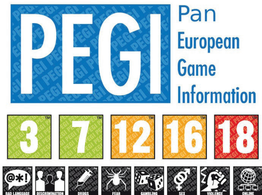
Slika 1. Način označavanja igrica po sistemu PEGI