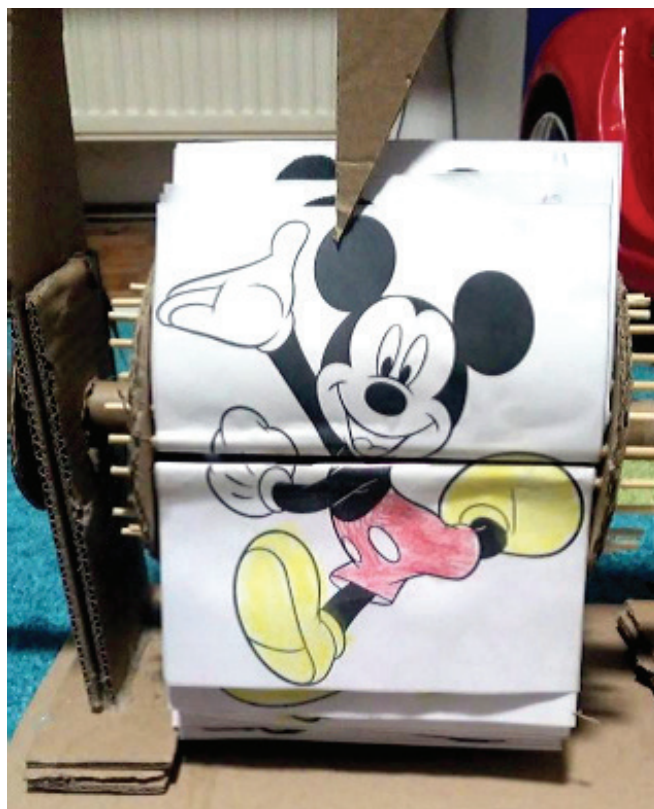
Slika 4. Animator "mašina" od kartona

jedan lik. Također, objasniti im da se ovi papiri moraju brzo listati, što odgajatelj/odgajateljica ne može sam/sama, već je za to listanje potrebna mašina. Slijedi interakcija sa djecom: oni probaju listati. Tada im treba pokazati "animator mašinu" na kojoj se nalazi 26 likova Mikija Mause baš kao i oni prethodni crteži na flip chartu .