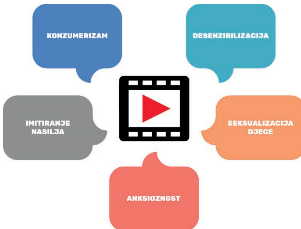
Slika 1. Moguće posljedice neprimjerenih medijskih sadržaja na djecu

Primjer: Arthur – slušajući dijaloge između članova porodice i prijatelja u ovom crtiću djeca uče kako razvijati komunikaciju i zdrave međuljudske odnose s drugim osobama, bez obzira na različite karaktere i interesovanja. Radnja i dijalozima bave mnogim važnim temama za djecu kao što su prijateljstvo, školovanja, vršnjačko nasilje. Ali, bavi se i porodičnim odnosima, kao i različitim situacijama s kojima se porodice susreću poput bolesti. Svaka epizoda je svojevrsna društvena lekcija prezentovana na zabavan i poučan način.