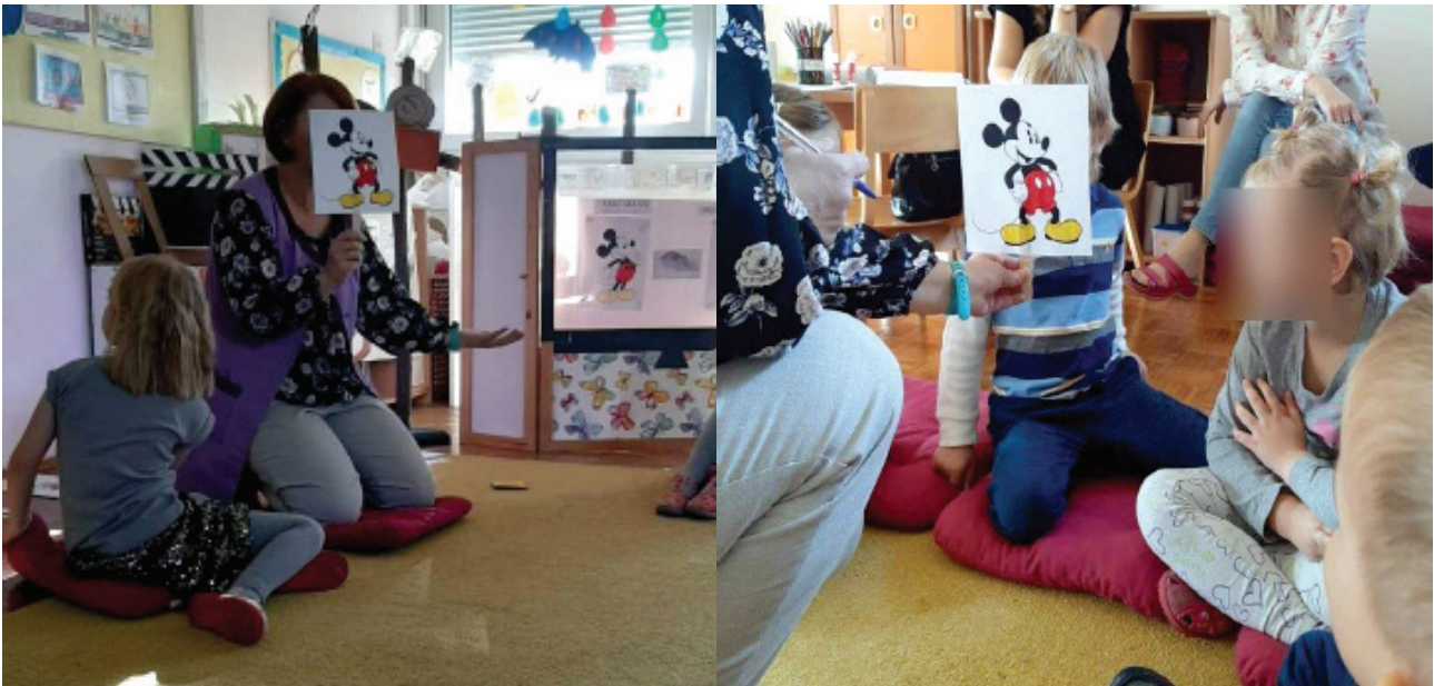
Slika 2. Crtani lik postavljen na štapić i glas odgajateljice koji se obraća djeci pomažu djeci da razumiju ko "posuđuje" glas crtanim likovima. Djeca koja žele "posuđuju" svoj glas Mikiju Mausu.

Odgajatelj/odgajateljica ponovo uzima Mikija Mausu na štapu, pokazuje da ga može pomjerati, ali cijelog. Pravi kružne pokrete, pomjera Mikija gore-dolje, ali ne može mu pomjeriti ruku, nogu... Kaže da nam je za to potrebno nešto drugo. Pomoću niza od 26 nacrtanih i obojenih likova Mikija Mausua (kojeg su obojila djeca), koji su poredani hronološki na chart , pojašnjava djeci šta je potrebno da se pokrene dio tijela nekog nacrtanog lika. Razgovarajući o tim crtežima Mikija Mausua navodi djecu da izraze svoje mišljenje. Šta prvo treba uraditi da se napravi crtani film? Treba zamisliti neki lik, pa nacrtati svaki pokret (pokazuje na primjeru 26 nacrtanih likova Mikija Mausua), obojiti, sve to analizirati pomoću charta sa 26 crtanih likova. Slijedi zaključak da se i dalje ti likovi