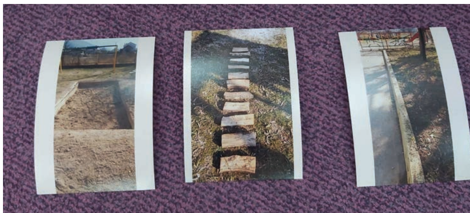
Slika 3. Pješčanik – mostić – ivičnjak

To su tri različite slike (pješčanik, mostić, ivičnjak). Djeca se raduju izazovu te rado učestvuju u njemu, ponavljajući na glas tri riječi: PJEŠČANIK – MOSTIĆ – IVIČNJAK