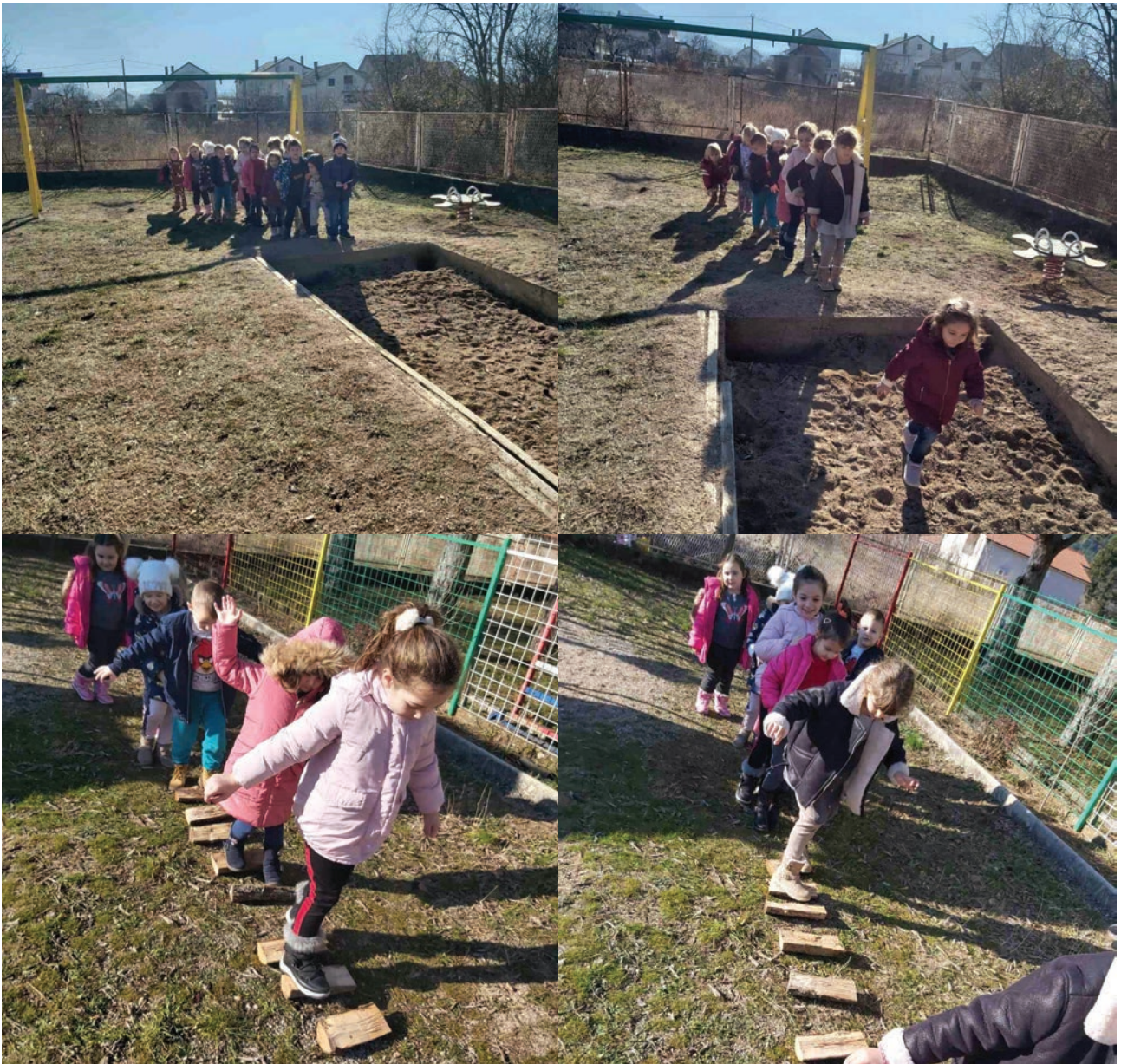
Slika 4. Savladavanje izazova po uzoru na Doru