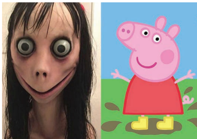
Slika 1. Lutka Momo vs. prase Peppa

Čak i naizgled potpuno benigni medijski sadržaji na internetu mogu sadržavati kadrove neprimjerne za djecu. Eklatantan primjer je pojavljivanje lutke Momo na online servisu Youtubeu tokom reprodukovanja crtića „Pepa prase“ i video igre „Fortnite“. Riječ je o fiktivnoj, ali za djecu zastrašujućoj lutki (slika 1) koja ih podstiče na izrazito opasne izazove kojima mogu povrijediti sebe i druge. Zbog brojnih neprimjerenih i štenih sadržaja na Youtubeu , kao i drugim online platformama, djecu nikada ne treba ostavljati uz online sadržaj, odnosno uz ekran bez nadzora . Samo nekoliko klikova mišem dijeli dijete od nasilnih, vulgarnih i potencijalno štetnih klipova.