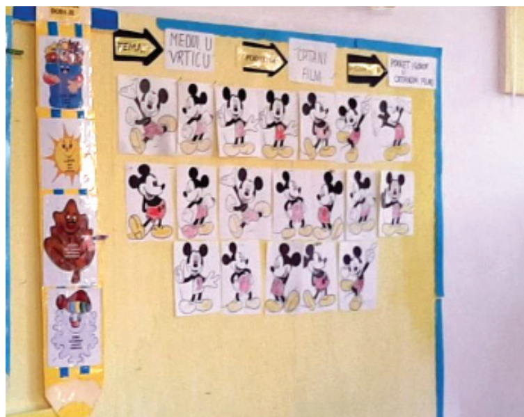
Slika 3. Niz nacrtanih i obojenih likova Mikija Mausua radi objašnjavanja pokreta

ne pomjeraju iako smo ih nacrtali, obojili i poredali jedan pored drugog. Šta dalje? Tada nastupa priča o animator "mašini" koja će pokrenuti lik Mikija Mausua. „Animator mašina“ je sprava od kartona koja omogućava pokretanje niza od 26 crteža Mikija Mausua: „Ples Mikija Mausua“. Djeca su obojila isti niz od 26 crteža kao iz predhodnog dijela razgovora o chartu . Važno je da budu isti likovi i sve isto kako bi djeca shvatila kontinuitet pri izradi pokreta u crtanim filmovima. Djeci pokazati da se ti crteži redaju jedan na drugu kao slikovnica, pa listanjem tih papira dobijemo sliku kao da se crtani likovi kreću. Da bi bolje shvatila listanje papira, djeci treba demonstrirati listanje pomoću jednog bunta od papira i ujedno kazati da je tako veliki broj crteža potreban da bi se pokrenuo