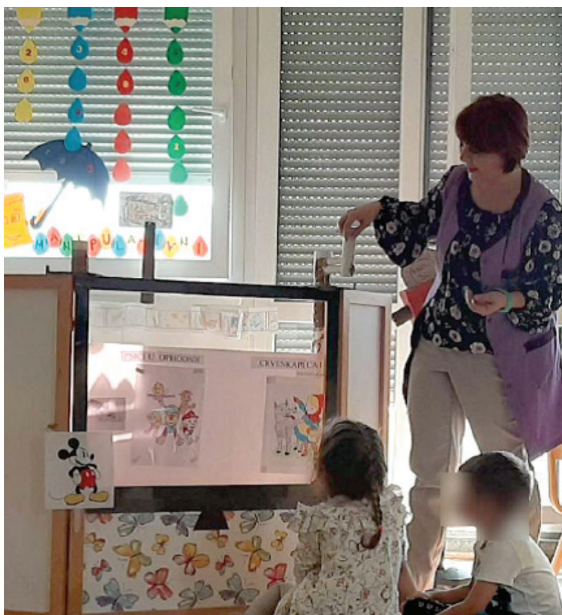
Slika 1. "Mašina" s pokretnim crtežima

Otkrivamo jedno po jedno polje i razgovaramo o likovima. Prva slika u nizu koja se pojavljuje na pokretnoj traci ili mašini sa pokretnom trakom je Maša i medo. Odgajatelj/odgajateljica pita da li su Maša i medo nacrtani i da li su dobri prijatelji? (Mogući odgovor „DA“).