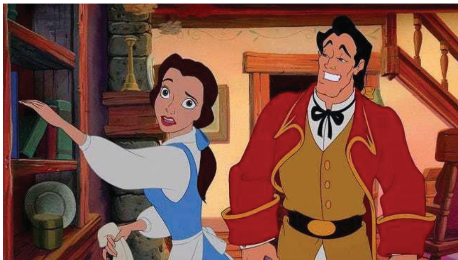
Slika 3. Likovi iz bajke „Ljepotica i zvijer“ – Bella i Gaston

Vježba: Izaberite crtić koji biste gledali s djecom. Kako biste podstakli dječiju kreativnost? Kako biste ukazali na razliku između fiktivnog i stvarnog? O čemu biste razgovarali s njima? Koja pitanja biste postavili? Koje poruke istakli?