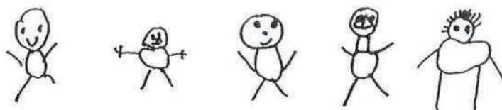
Crteži dece uzrasta-6 godina koji su izloženi televiziji više od tri sata dnevno