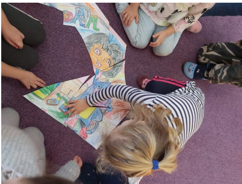
Slika 1. Uživanje u odabiru slagalice u manipulativnom centru

Zadatak druge grupe je sliku izrezanu u osam dijelova složiti u jednu cjelinu. To je bila slika Dore izrezana u osam nepravilnih i nejednakih oblika koji moraju biti pravilno složeni.