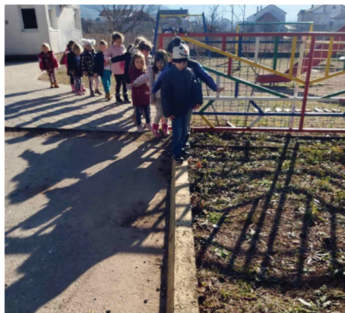
Slika 5. Igre vani inspirisane Dorom