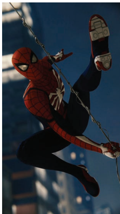
Slika 2. Tipičan izgled ženskih i muških likova u crtićima