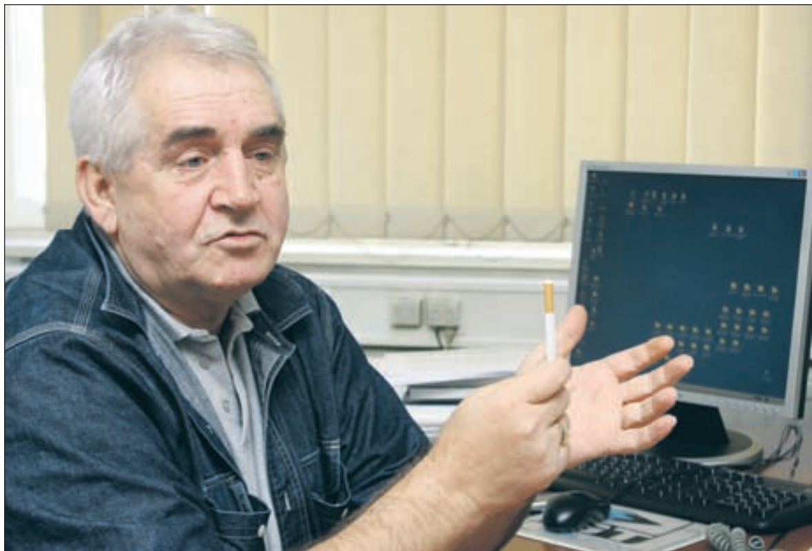
Kopanja: Značajno je što se Dodik pridružio izvinjenjima za sve nevine žrtve

karcinom koji je zahvatio cijelu Bosnu i Hercegovinu