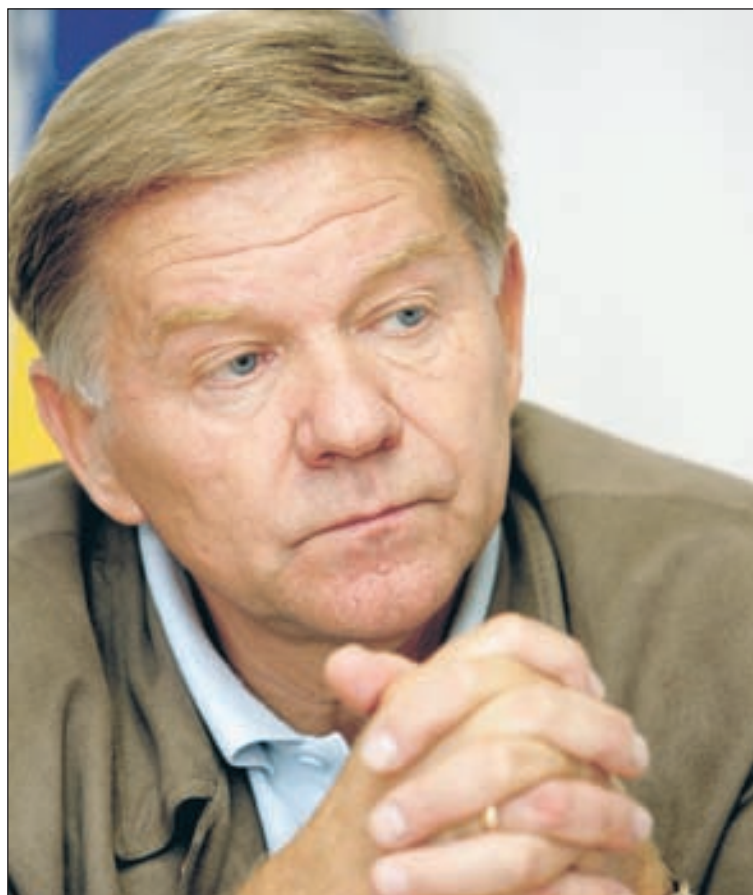
Komšić: Precizna dijagnoza

Sjetite se kampanja vođenih u nekim medijima, a on je takav da odgovara odmah na prvu, i onda kaže svasta, često ono i što ne misli. Međutim, pogledajte i preslušajte inauguralni govor. To je ozbiljan Dodik.