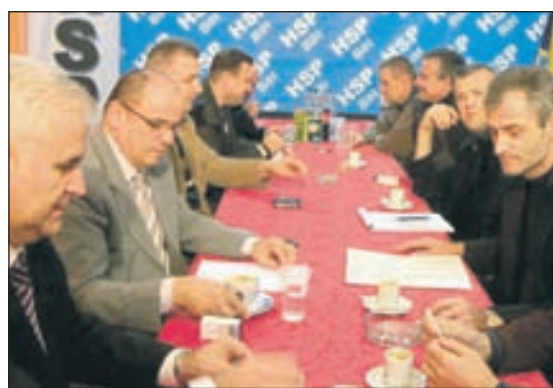
Mostar: S međustranačkog sastanka

druge narode ako su neravnopravni na pojedinim prostorima - kazao je Jurišić, javila je Onasa.