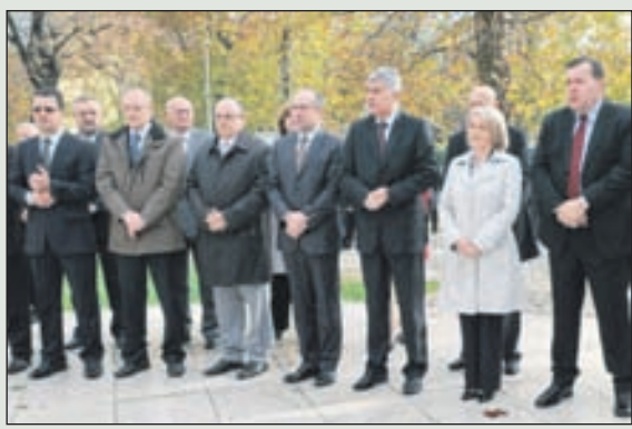
Sa svečane akademije: Intonirana himna Hrvatske