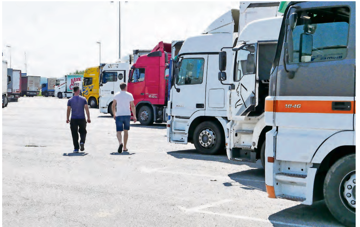
Carinski terminal GP Rača

Po nalogu Tužilaštva KS-a pripadnici MUP-a uhapsili su muškarca K. K. zbog krivičnog djela prevara. Sumnjici se da je tokom ove godine doveo u zabludu više osoba lažno se predstavljajući da je uposlenik Ambasade SAD-a u Sarajevu i da je osnivač američke firme Academy za koju traži uposlenike kojima je potrebna nostrifikacija diplome o stečenom zvanju u BiH. Tako je od dvije osobe uzeo po 5.000 KM, dok je treća odbila dati, nakon što joj je tražio 2.260 KM za fiktivno zaposlenje. Tužilaštvo provjerava još deset osoba koje bi mogle biti oštećene u ovom slučaju. Za osumnjičenog je predložen pritvor.