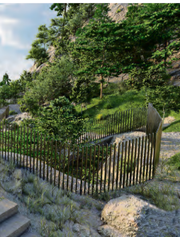
Jozića reflektuje izvjesnost sudbine žrtava

Ono što se može mijenjati je sadašnjost koja treba biti most kojim će se koračati ka ljepšoj budućnosti, kažu Jasmin i Ilma Sirčo i Dunja Krvavac