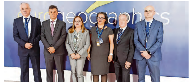
Sa početka Skupštine

"I mi u Federaciji BiH želimo i radimo na tome da prostorne informacije učinimo dostupnim korisnicima na najbrži i najjednostavniji način u bilo kojem mjestu. Osnov toga je stvaranje infrastrukture prostornih podataka", kazao je premijer Novalić, te podsjetio da je aktuelna vlast pripremila i usvojila Zakon o infrastrukturi prostornih podataka FBiH.