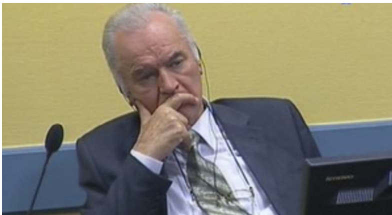
Ratko Mladić u sudnici.

U nastavku suđenja Ratku Mladiću, ekspert Haškog tužilaštva za minobacače Richard Higgs prošle sedmice je potvrdio nalaze istraga o eksplozijama u Sarajevu 1994. i 1995. godine, po kojim su granate koje su usmratile i ranile stotine civila bile ispaljene sa srpske strane.