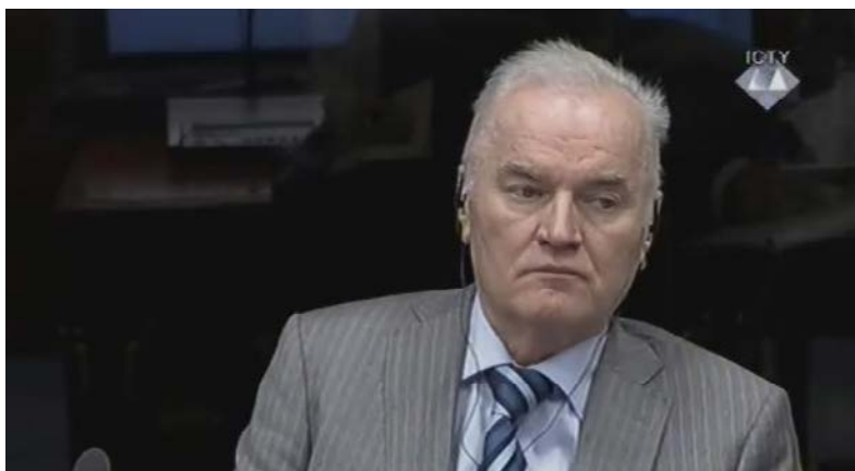
Ratko Mladic.

U nastavku suđenja Ratku Mladiću, nekadašnji predsjednik opštinske vlade na Palama Zdravko Čvoro rekao je da su Bošnjaci u proljeće 1992. godine dobrovoljno otišli s područja te opštine, te da nisu protjerivani.