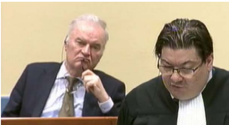
Ratko Mladić i njegov advokat Dejan Ivetić u sudnici.

Tokom završnih riječi na suđenju Ratku Mladiću odbrana je rekla da haški tužioci nisu dokazali da su snage bivšeg ratnog komandanta Vojske Republike Srpske počinile genocid u šest bosanskohercegovačkih opština 1992. godine.