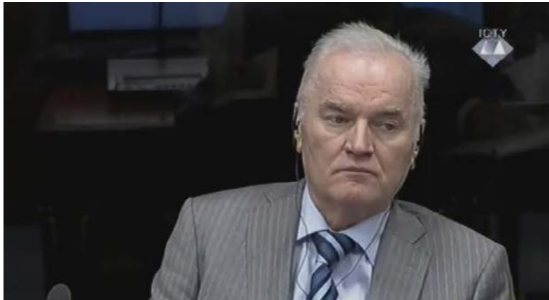
Ratio Mladic.

U nastavku haškog suđenja Ratku Mladiću, svjedok Odbrane Miloš Milinčić kazao je da je mislio da je tokom rata u BiH veći dio Muslimana i Hrvata ostao u opštini Srbac.