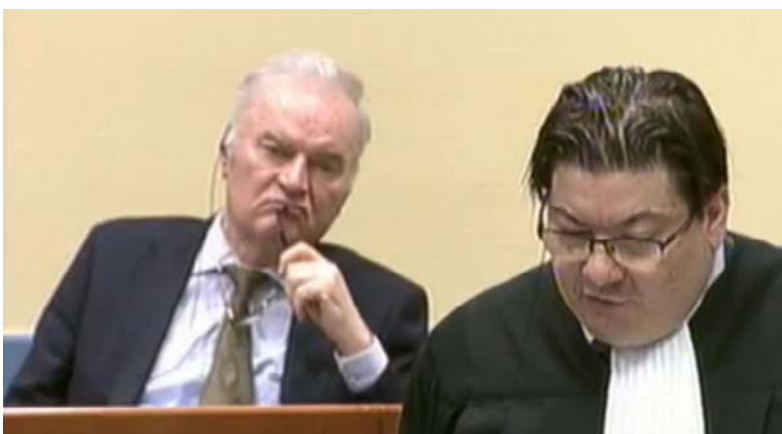
Ratko Mladić i njegov advokat Dejan Ivetic u sudnici.

Advokati Odbrane i Tužilaštva dali su svoje završne komentare na suđenju bivšem ratnom komandantu Vojske Republike Srpske (VRS), koji je optužen za genocid i druge zločine. Sudije su okončale postupak i sada slijedi period razmatranja njihove presude.