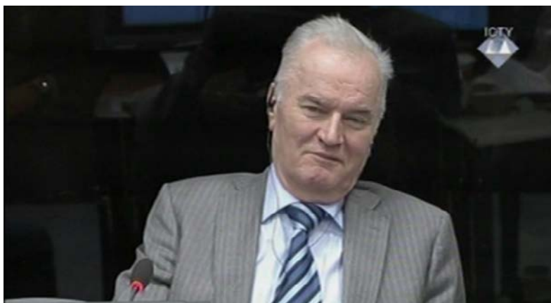
Ratko Mladić u sudnici u Hagu.

Vojni ekspert Richard Butler izjavio je da je odluka o strijeljanju Srebreničana bila donijeta u noći 11. na 12. jul 1995. godine, između dva sastanka na kojima je komandant Vojske Republike Srpske (VRS) Ratko Mladić poručio Bošnjacima da mogu “opstati ili nestati”.