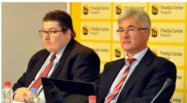
Advokati Mladića na pres-konferenciji u Beogradu.

Advokati Ratka Mladića najavili su mogućnost da pozovu građane Srbije da izađu na proteste kako bi podržali njihov zahtev za privremeno oslobađanje ratnog komandanta bosanskih Srba.