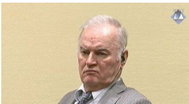
Ratko Mladić u sudnici.

Prvostepena presuda bivšem komandantu Vojske Republike Srpske (VRS) Ratku Mladiću, optuženom za genocid i progon širokih razmjera počinjenih tokom rata u Bosni i Hercegovini, biće izrečena slijedećeg mjeseca.