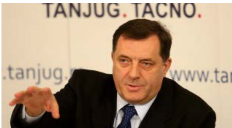
Milorad Dodik svjedoči u Hagu.

Milorad Dodik, predsjednik Republike Srpske, na suđenju optuženog za ratne zločine, Ratka Mladića, rekao je da etničko čišćenje Bošnjaka i Hrvata, nije bila zvanična politika RS-a.