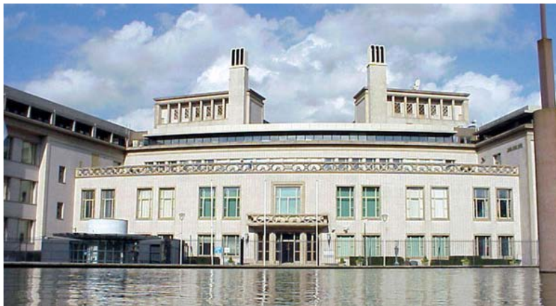
Zgrada haškog tužilaštva.

Dva bivša pripadnika Vojske Republike Srpske rekli su na suđenju Ratku Mladiću da su bošnjačke snage odgovorne za napade na civile tokom opsade Sarajeva.