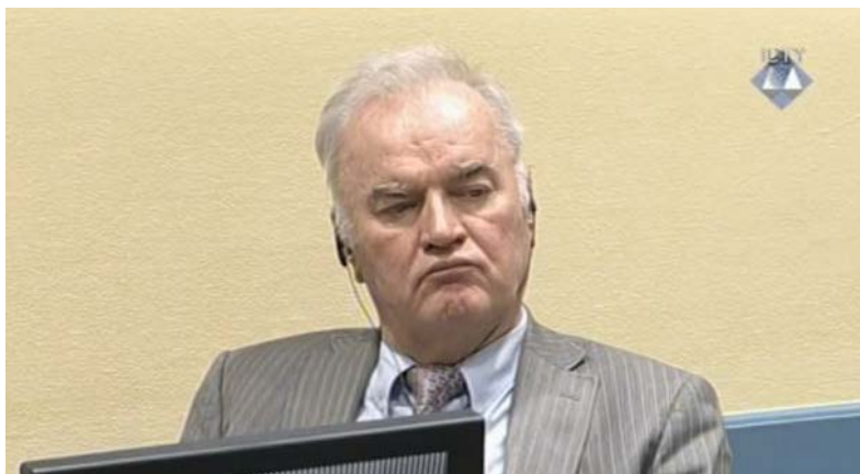
Ratko Mladić u sudnici.

Haško tužilaštvo je na suđenju Ratku Mladiću pred sudije izvelo posljednjeg svjedoka, vojnog eksperta Reynauda Theunensa, koji je rekao da je optuženi bio uključen u operacije Vojske Republike Srpske (VRS) na terenu, predvođeci borbena dejstva.