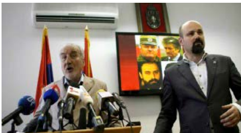
Vladimir Vukčević, glavni tužilac za ratne zločince, i Bruno Vekarić, zamenik tužioca.

Srpsko tužilaštvo obelodanilo je u petak da je u toku krivični postupak protiv 13 osoba za koje se sumnja da su učestvovale u pomaganju i skrivanju Ratka Mladića i Stojana Župljanina.